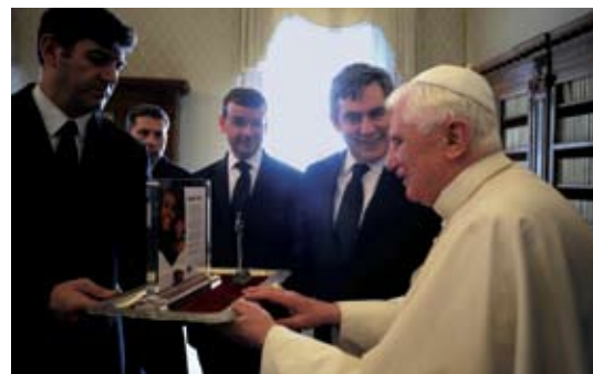
Pave Benedict XVI mottar IFFIm-gaven fra den britiske statsministeren Gordon Brown