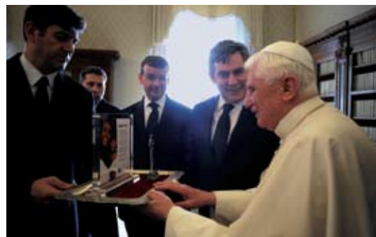
Papst Benedikt XVI. erhält das IFFIm-Geschenk vom britischen Premierminister Gordon Brown.

in der Timbicho-Gesundheitsstation im südlichen Äthiopien.