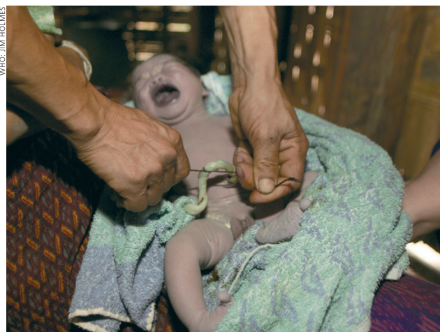
Этот снимок сделан в Лаосе во время родов на дому без участия акушерки. Отец перерезает пуповину бамбуковой лучиной.

Финансирование в рамках IFFIm составляет около 80 % всего внешнего финансирования, вы-