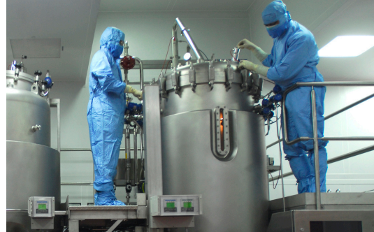
ГАВИ: ATUL LOKE

Сложной задачей остается среднесрочное финансирование с потребностью 355 млн. долларов на проведение мероприятий в 2008 г. Инициативу