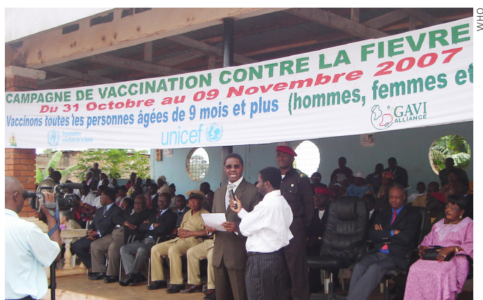
Камерун: министр здравоохранения одобряет и приветствует международное партнерство ВОЗ, ЮНИСЕФ, ГАВИ, Врачей без границ и Общества Красного Креста Камеруна, что сделало возможным проведение кампании иммунизации для профилактики вспышки желтой лихорадки.

Генеральный директор ВОЗ д-р Маргарет Чен.